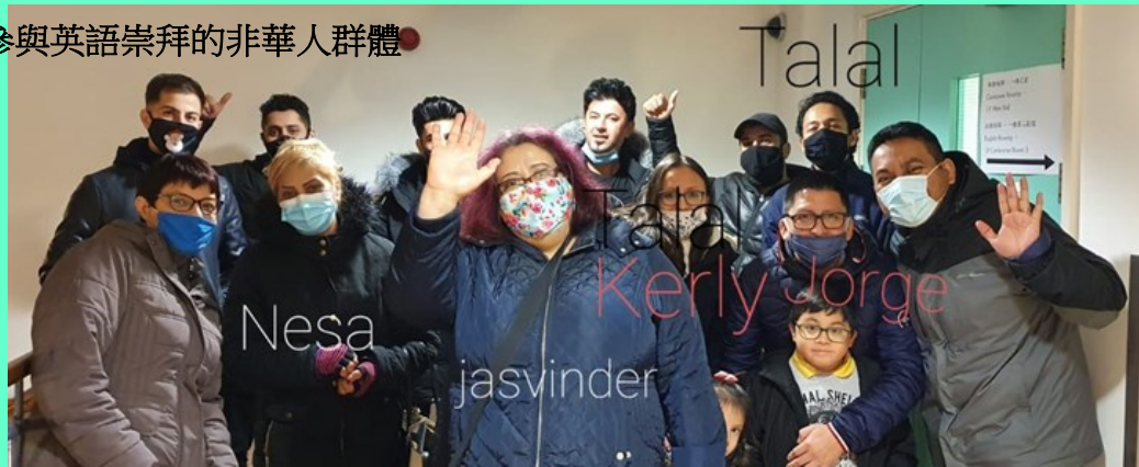
參與英語崇拜的非華人群體

聖誕節當日，曼宣舉辦了網上聖誕崇拜直播，並在崇拜後，加設一個團契時間，讓整個教會兄姊在網上房間有遊戲聯誼的機會，增添節日氣氛。