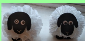
兒童主日學的手工