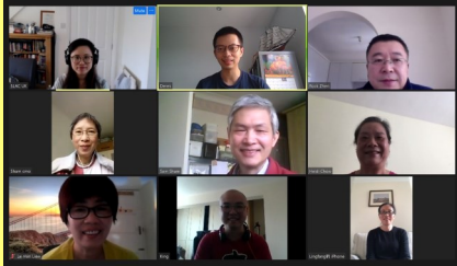
每周日教會禱告會

沒有實體的活動，看起來教會好像停滯了似的，而事實上，正好相反，就是因為要聯絡各自呆在家中的肢體，南宣增加了一些活動。以廣東話婦女組為例，增加了每星期有三個早上一齊跳讚美操半小時，一方面讚美神，同時又可以鍛鍊身體，還增加閒聊時間，讓姊妹們天南地北，無所不談。國語組也不甘後人，增加了一個慕道者聚會，大家在網上一齊閱讀“標竿人生”，每回都有熱烈討論。弟兄組查經人數也略有增加。而職青組也增加了“生命傳奇”查經聚會，引導慕道者明白救恩。