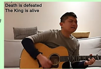
英文崇拜主席自彈自唱領詩