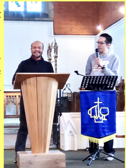
柬埔寨宣教士分享