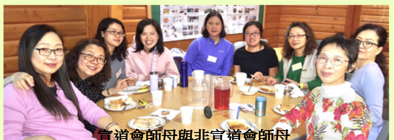
宣道會師母與非宣道會師母