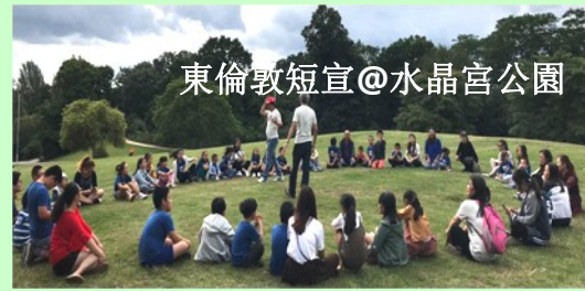
東倫敦短宣@水晶宮公園

今年暑假，曼宣舉辦了一連串的活動，除了少年營和兒童日營外，自去年開始，我們籌組了短宣隊，前往東倫敦宣道會舉辦兒童日營。感謝神帶領今年的短宣，參與的隊員同心事奉，互相配搭補位，大家都有深刻的體會。雖然今年共有 8 位成員，但要帶領 30 位活潑的孩子完成四日的活動，也實在需要加倍的體力和神額外的恩典。