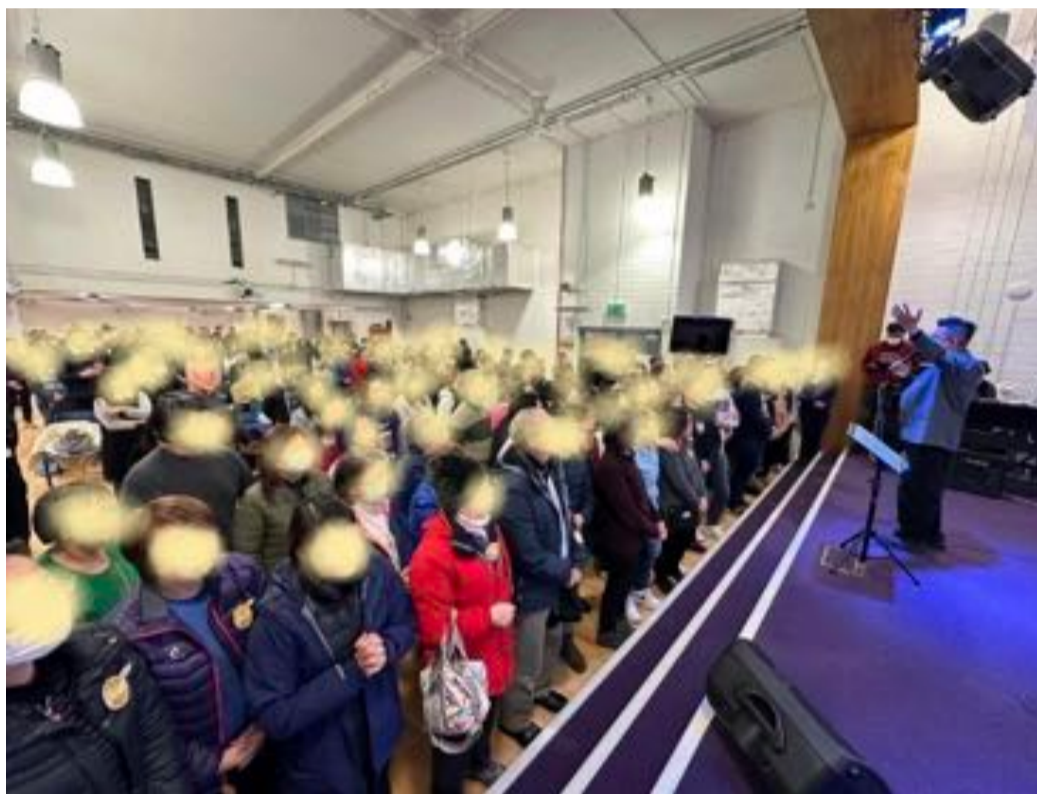
同心圓音樂佈道會參加者到台前決志