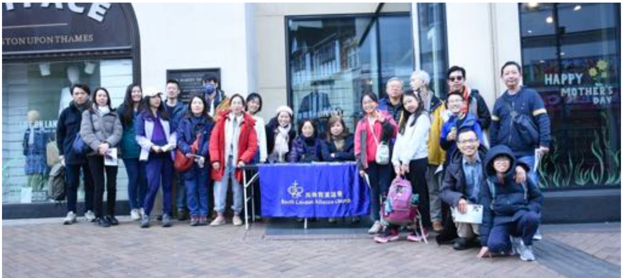
派發單張時的合影