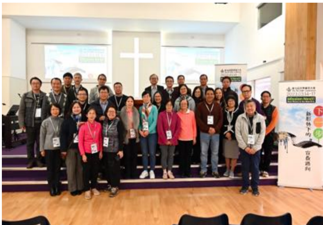
參加今年世宣大會的英國區華人宣道會同工和信徒領袖

感謝神，在四日的會議期間，我們有機會認識不同地方華人宣道會的事工和生命見證，特別自疫情後，能面對面傾談、直接溝通，大家都把握時間與不同單位的人聯繫，甚至商討合作的可能性。大會最後一天，英國和澳洲獲選為新一屆世宣的執委，與美國、加拿大和香港三個必然成員，組成新一屆執委會，當日亦議決了三年後，下一屆的會議地點為台灣。願主使用世宣工作，促進世界各地華人宣道會毋忘初心，致力推動和參與普世宣教工作。