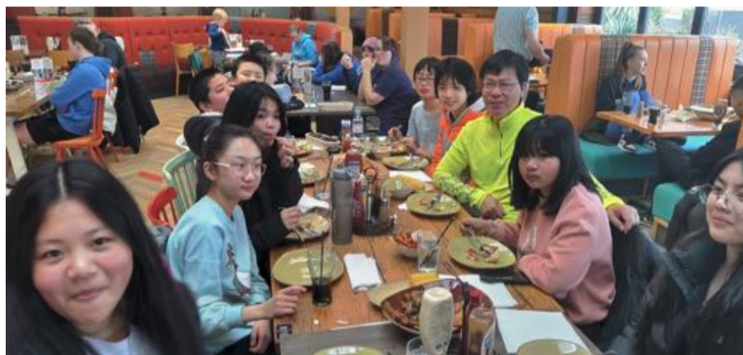
「春令營」與少年人在一起

現時每主日固定崇拜會眾平均有五十多人。每週兒童主日學有學員約二十人。固定的聚會包括：從4月30日起，每主日「東宣」將有兩堂崇拜。每月首個主日的普通話廣東話聯合同領聖餐主日崇拜（以普通話進行並於證道環節輔以廣東話翻譯）；每月其他主日的分堂崇拜（普通話2pm，廣東話3:30pm）；兒童主日學（於聯合崇拜或普通話崇拜時段進行）；每月第一及第三個週二晚上8-10pm舉行的廣東話查經班；每月第一及第三個週二早上10am-12pm有普通話家庭關懷小組聚會。