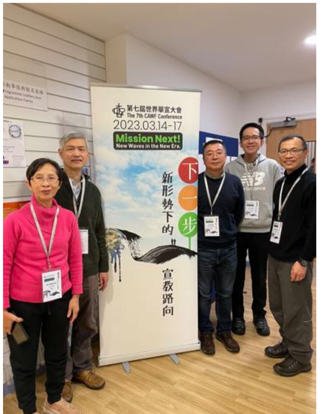
教牧同工、領袖參加「世宣大會」合影

隨著「南宣家」人數的增長，教會前面的小街也都停滿了參加主日敬拜者的車輛，遲來的朋友便只能停的遠一點，步行參加敬拜，算是一點「小煩惱」。