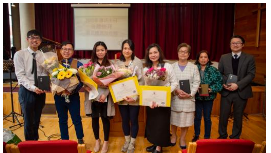
洗禮後頒發證書合影

至於今年復活節洗禮，感恩神預備了四位肢體參與，他們完成了半年的洗禮班、閱讀交流、課堂回饋及撰寫見證等，也與教牧執事約談，了解他們的信仰狀況，為他們個人和家庭的需要守望；最終他們便在教會群眾的見證下，接受洗禮，歸入主的名下，見證上帝在他們生命中一直的恩典與作為！當日，弟兄姊妹興奮歡樂，配搭服事，一起迎接幾位新葡的洗禮，聚會大家亦不忘拍照留念，期望惦記著一份在神家共聚，心願同行天路的溫暖。