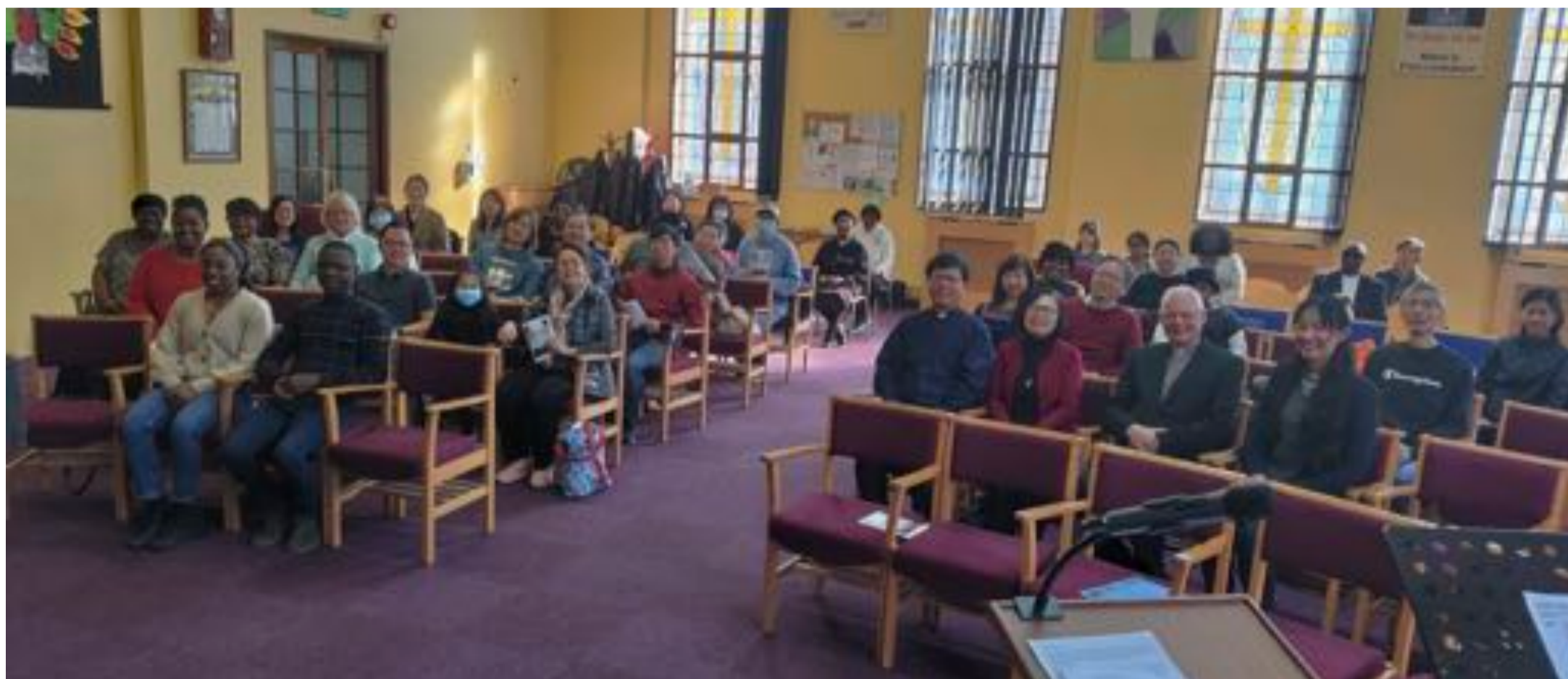
浸禮及於西人教會舉辦「受苦節」

於今年4月7日「東宣」與所借用的 Deptford Methodist Church 合作舉行受難節聯合崇拜，出席有50多人。4月9日「東宣」於復活節主舉行了第六屆洗禮，有兩位肢體受洗加入教會。於4月10-14日教會有38位大小肢體前往 Skegness 參加「Spring Harvest 生活營」，神賜福參加的肢體有美好的學習及在主內有更深認識感恩。從五月份開始逢週三早上將有普通話領袖門訓。